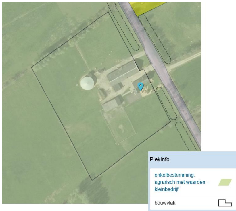
Uitsnede geldende bestemmingsplan Buitengebied

Het perceel Bethlehemsreed 4 te Boelenslaan valt onder het bestemmingsplan Buitengebied Achtkarspelen 1 en heeft daarin de bestemming 'Agrarisch met waarden - Kleinbedrijf'. Deze bestemming is gegeven aan percelen waar nog agrarische activiteiten plaatsvinden die het hobbymatige overstijgen, maar ook geen volwaardig agrarisch bedrijf vormen (oppervlakte agrarische grond 5 tot 15 ha).