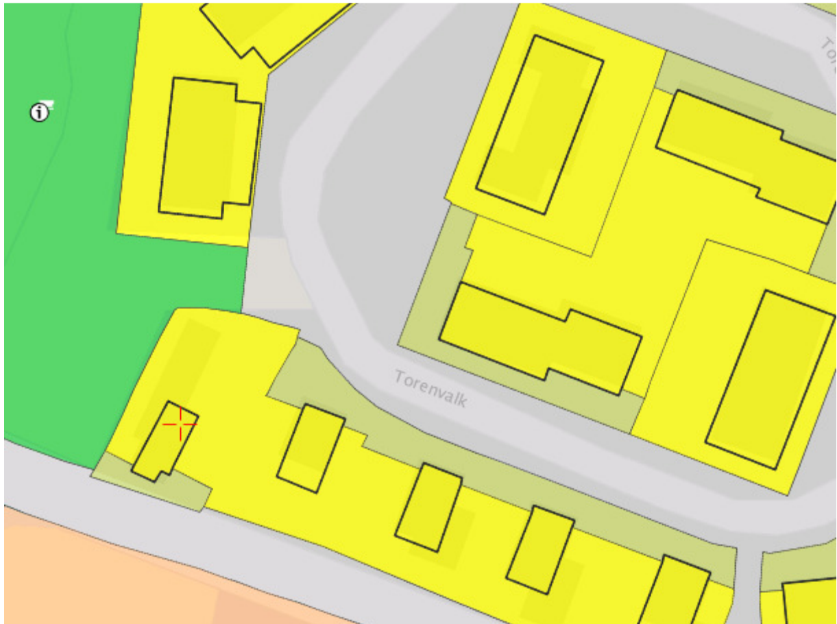
Uitsnede bestemmingsplan Surhuisterveen Dorp

De locatie Torenavalk 58a in Surhuisterveen valt onder het bestemmingsplan Surhuisterveen Dorp en heeft de bestemming Wonen. Het bouwplan is in strijd met dit bestemmingsplan omdat op woning is geprojecteerd buiten het bouwvlak. In de planregels is opgenomen dat burgemeester en wethouders voor deze locatie, als wordt voldaan aan de genoemde voorwaarden, het plan kunnen wijzigen en een bouwvlak kunnen veranderen.