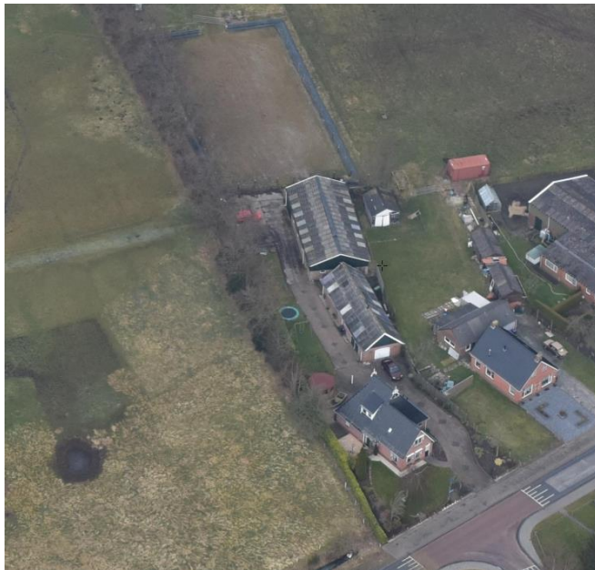
Perceel met woning Ds. Visscherwei 54 te Boelenslaan

Het betreft een voormalig agrarisch (klein)bedrijf waarvan de agrarische activiteiten zijn beëindigd. Het perceel met opstallen is verkocht en de nieuwe eigenaren willen het pand alleen gebruiken voor reguliere bewoning en niet meer voor agrarische activiteiten. Omdat het perceel in het geldende bestemmingsplan nog een agrarische bestemming heeft, moet dit worden gewijzigd naar de bestemming Wonen.