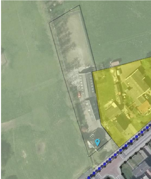
Uitsnede geldend bestemmingsplan perceel Ds. Visscherwei 54 te Boelenslaan