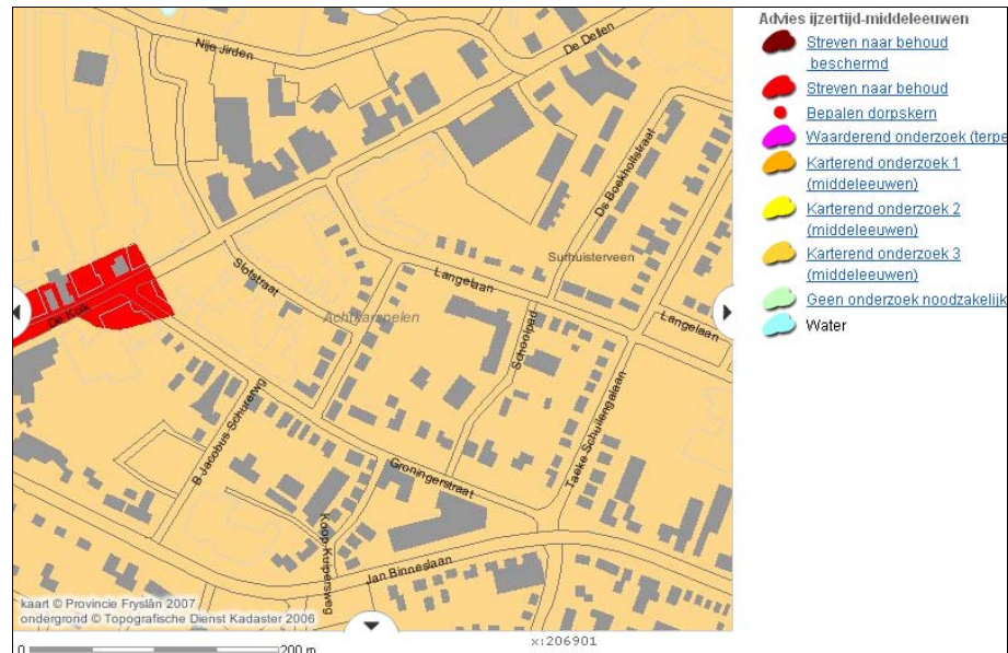
Figuur 5 Fragment FAMKE - periode ijzertijd-middeleeuwen

CONCLUSIE In het voorliggende bestemmingsplan zijn geen ontwikkelingen met een oppervlakte van ten minste 5.000 m 2 voorzien. Het uitvoeren van een karterend proefsleuvenonderzoek of een historisch en karterend onderzoek is dan ook niet noodzakelijk. Dit betekent dat de uitvoerbaarheid van het voorliggende bestemmingsplan niet door archeologische waarden wordt belemmerd.