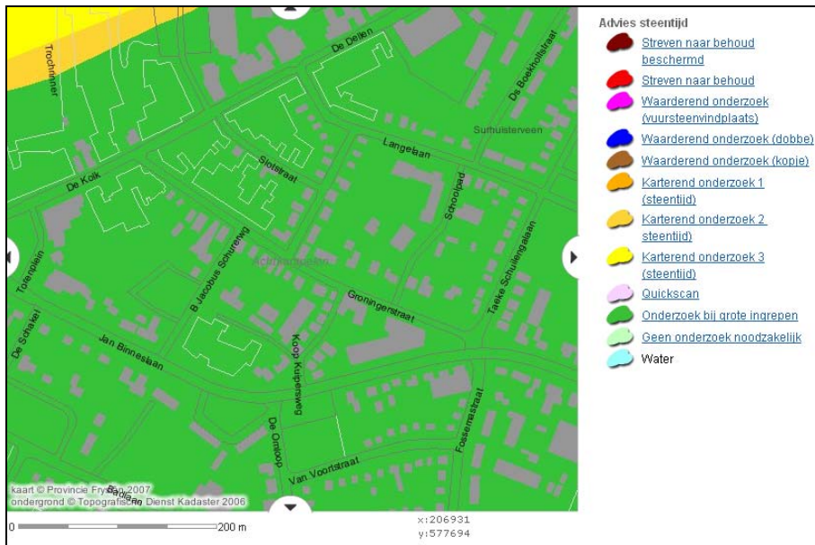
Figuur 4: Fragment FAMKE - periode steentijd-bronstijd

Ook blijkt uit de informatie dat wat betreft de ijzertijd-middeleeuwen het plangebied op de FAMKE is aangeduid als 'karterend onderzoek 3 (middeleeuwen)'. In deze gebieden kunnen archeologische waarden uit de periode midden-bronstijd-vroege middeleeuwen aanwezig zijn. Het betreffen hier vooral vroeg- en middeleeuwse veenontginningen. De provincie geeft dan ook het advies om bij ontwikkelingen van ten minste 5.000 m 2 een historische en karterend onderzoek uit te voeren. Hierbij moet in het bijzonder aandacht zijn voor mogelijke sporen van Romeinen en vroeg-middeleeuwse ontginningen. Het wat betreft de ijzertijd-middeleeuwen voor het plangebied betreffende fragment van de FAMKE is in figuur 5 opgenomen.