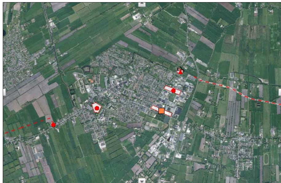
Figuur 6. uitsnede risicokaart provincie Fryslân

Op de risicokaart van de provincie is weergegeven dat in de omgeving van het plangebied drie risicobronnen aanwezig zijn. Het betreft Avek international b.v. aan de Molenweg 2, Firma De Poel aan de Molenweg 10 en Automobielbedrijf Reitsma aan het Koartwald 6. In het eerste geval gaat het om een BRZO-bedrijf, in het tweede geval om een opslag van ammoniak en in het derde geval om een opslag van LPG.