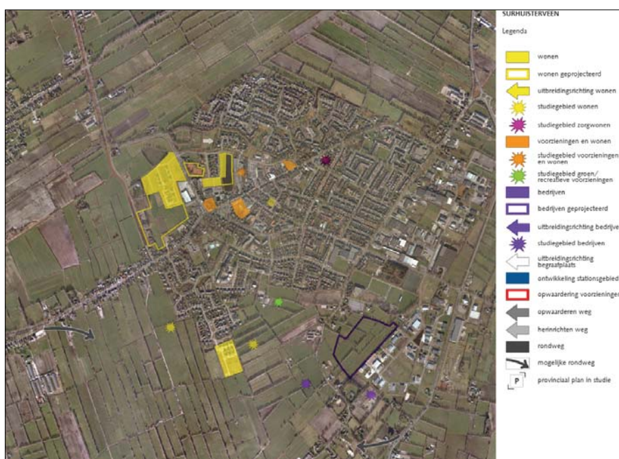
Figuur 1. Kaartbeeld uit concept structuurvisie

Uit bijgaand kaartbeeld blijkt dat de locatie van het voorliggend plan op de nominatie staat om te worden ontwikkeld voor woningbouw en aansluit bij de beleidsdoelstellingen.