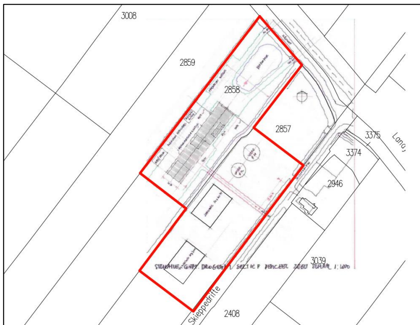
Figuur 1 Voorgenomen ontwikkeling binnen het plangebied.

Het voornemen is om de locatie bouwrijp te maken en hier nieuwbouw te realiseren voor de vestiging van de dierenartspraktijk. Er wordt vanuit gegaan dat (in worst-case scenario) hiervoor kap van enkele bomen en het rooien van struikgewas nodig is en mogelijk een deel van de omliggende sloot moet worden gedempt.