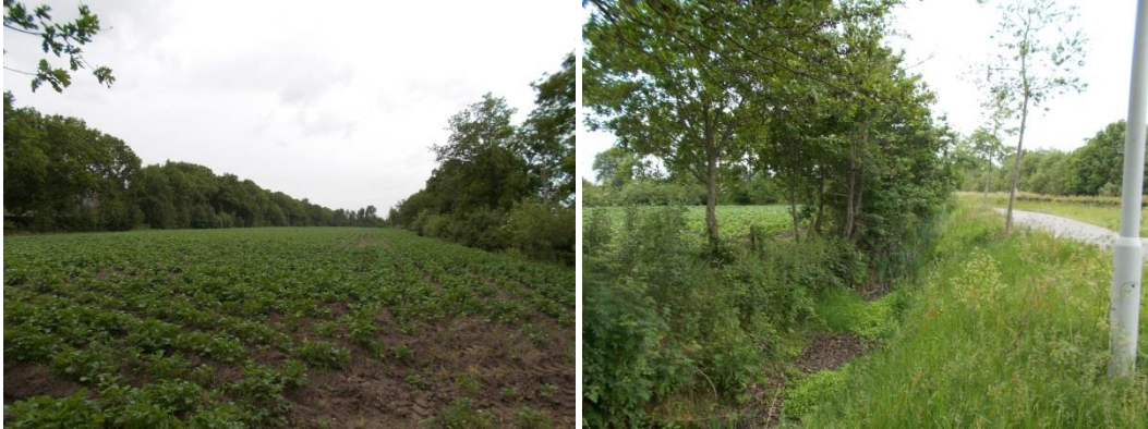
Foto 1 Impressie van het landbouwperceel met omliggende bomenrijen en droge sloot langs Landyk.

Het plangebied is gelegen in de oksel van de wegen Landyk en Skieppedrifte. Het bestaat in de huidige situatie uit landbouwpercelen waar aardappelen worden verbouwd. Rondom de percelen zijn droog liggende sloten gelegen. De randen van de percelen zijn begroeid met bomenrijen en ondergroei van struikgewas. Zie foto 1 | voor een indruk van het plangebied.