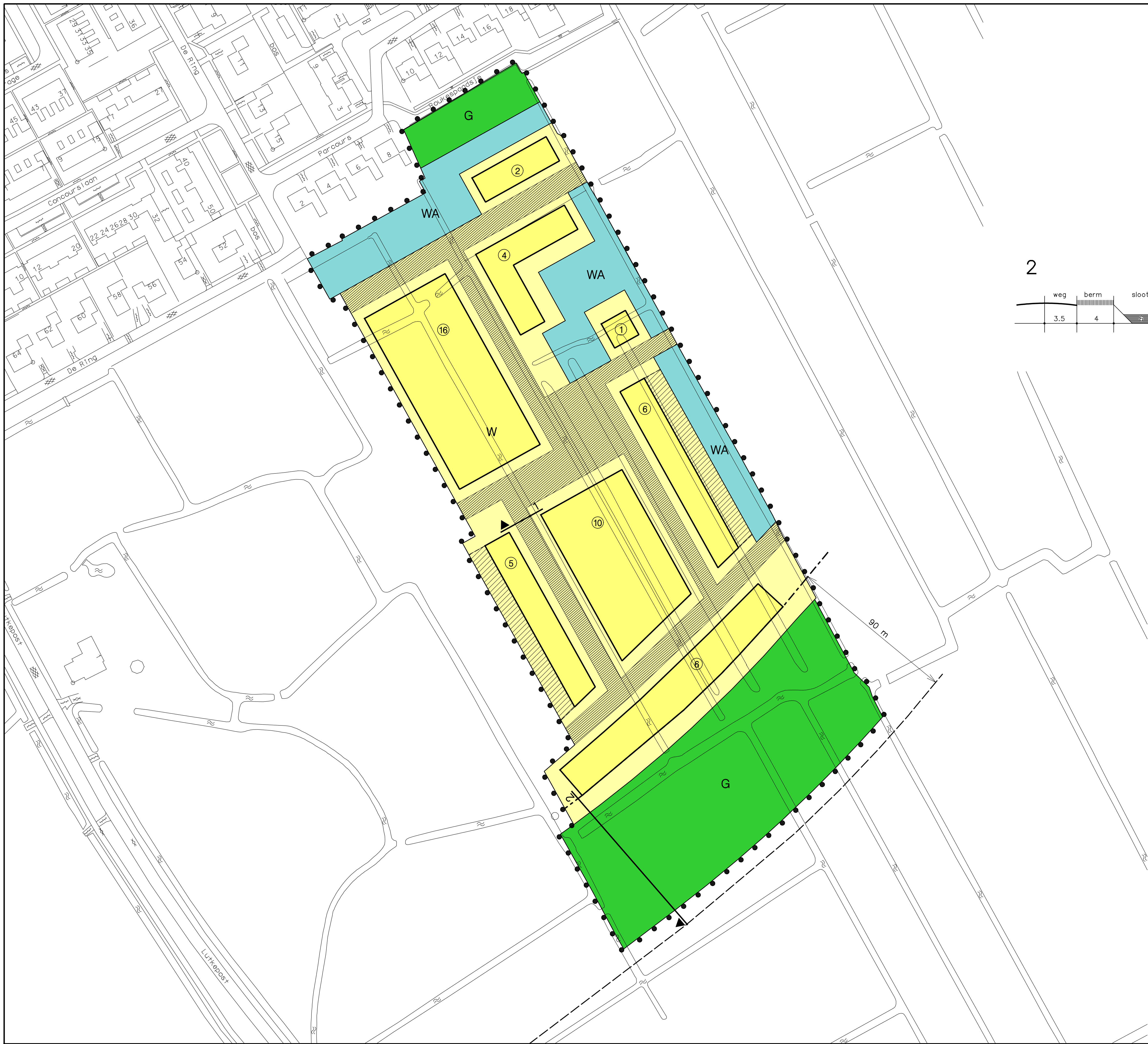
Dwarsprofielen schaal 1: 200