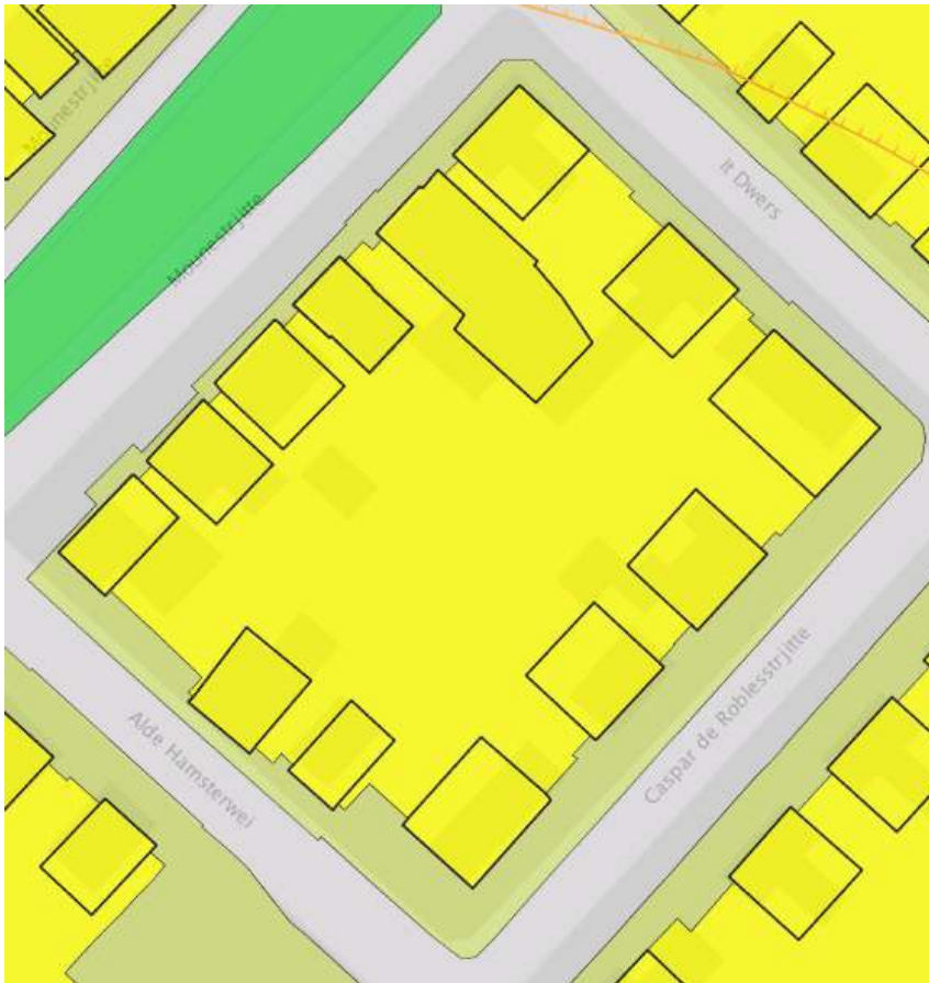
Uitsnede bestemmingsplan Kootstertille

De percelen Caspar de Roblesstrjitte 5 t/m 11, It Dwers 2 t/m 10 en Mounestrijtte 14 en 16 te Kootstertille vallen onder het bestemmingsplan Kootstertille 1 . In dit bestemmingsplan hebben de betreffende percelen de bestemming Wonen. De nu aangevraagde bouwplannen voor het herbouwen van drie van de vijf blokken zijn in strijd met dit bestemmingsplan omdat de woningen het bestaande bouwvlak overschrijden. In de planregels is opgenomen dat burgemeester en wethouders voor deze locaties, als wordt voldaan aan de genoemde voorwaarden, het plan kunnen wijzigen en een bouwvlak kunnen veranderen.