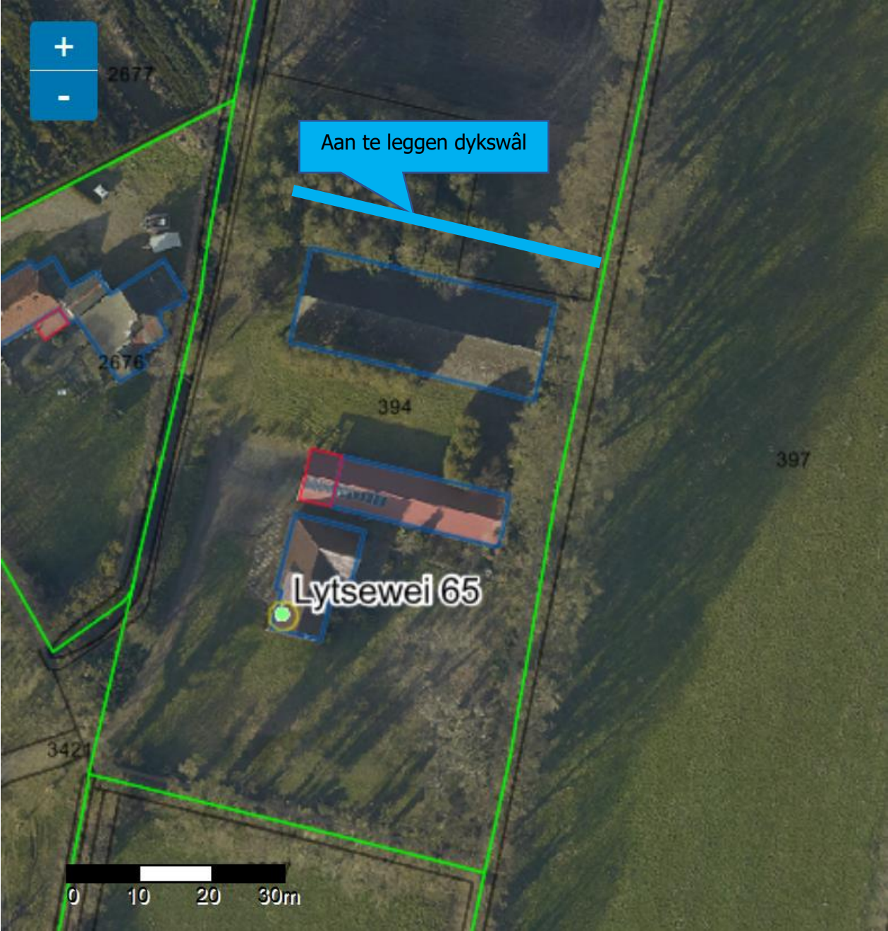
Afbeelding: landschappelijke inpassing Lytsewei 65 Harkema