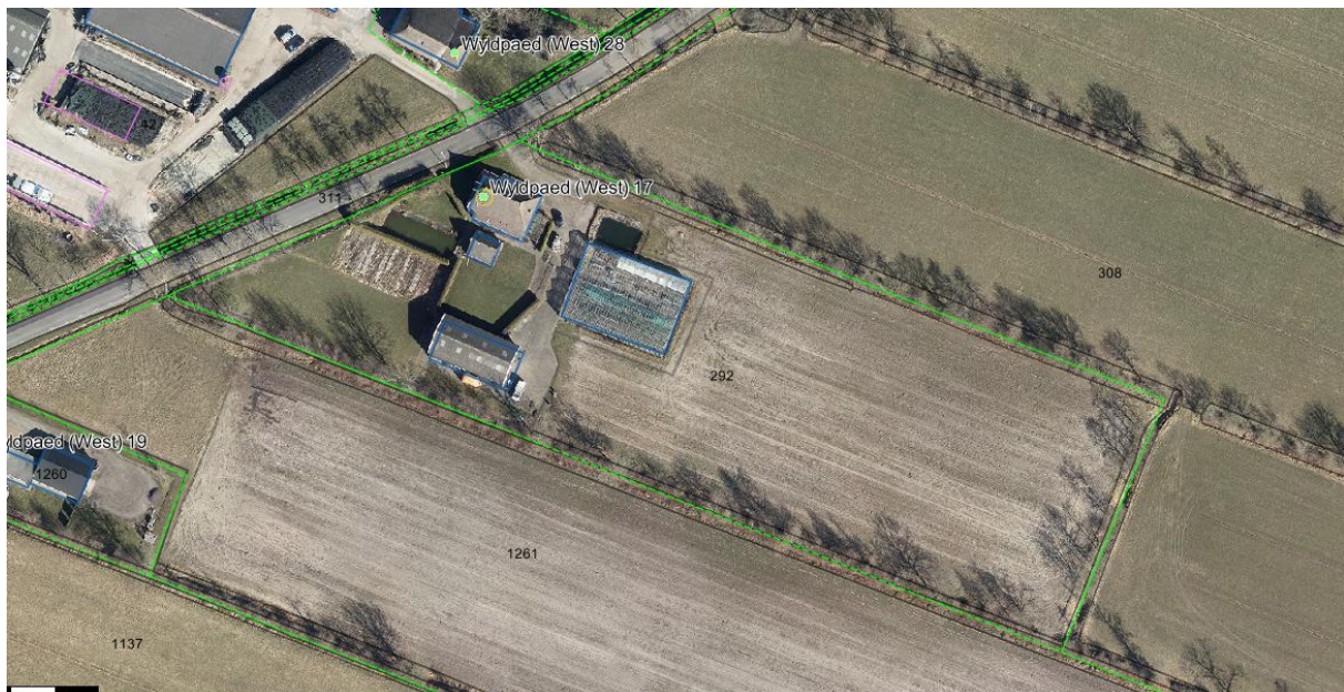
Luchtfoto Wyldpaed (west) 17 te Twijzelerheide e.o.

Dit wijzigingsplan heeft betrekking op het perceel Wyldpaed (west) 17 te Twijzelerheide, kadastraal bekend als gemeente KTN00, sectie E, perceelnummer 292.