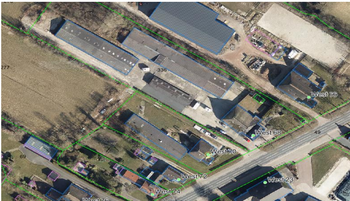
Luchtfoto West 68 en 70 te Buitenpost e.o.

Dit wijzigingsplan heeft betrekking op het de percelen West 68 en 70 te Buitenpost en zijn kadastraal bekend als Buitenpost, sectie E, perceelnummer 336 resp. perceelnummer 72. Het plangebied ligt aan de provinciale weg N 355 tussen Buitenpost en Twijzel.