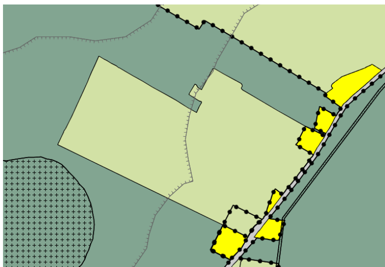
Uitsnede bestemmingsplan Buitengebied – ten westen van de Alde Dyk

Daarnaast heeft een deel van de gronden de aanduiding 'overige zone-weidevogelleefgebied'. De gronden ter plaatse van de aanduiding "weidevogelleefgebied" zijn, behalve voor de andere daar voorkomende bestemming(en), tevens aangeduid voor het instandhouden van de weidevogelleefgebieden. Deze aanduiding wordt niet gewijzigd en opgenomen in het wijzigingsplan.