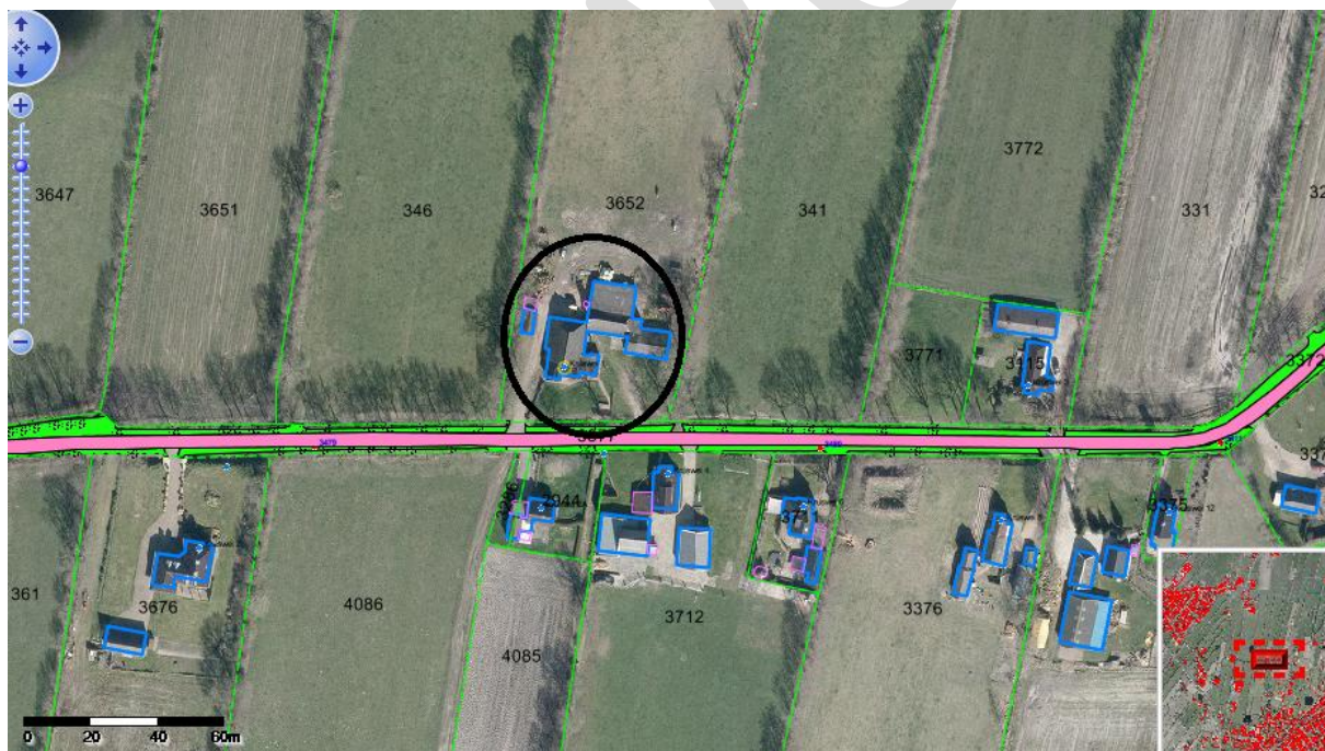
Krúswei 1 en omgeving te Harkema

Er is op 29 augustus 2014 een verzoek binnengekomen om de bestemming van het perceel aan de Krúswei 1 te Harkema te wijzigen van een agrarische bestemming naar een woonbestemming. De aanvrager geeft aan dat op het perceel geen dieren meer worden gehouden ten behoeve van de exploitatie van een agrarisch bedrijf. De ammoniakrechten van het bedrijf worden overgedragen aan een ander agrarisch bedrijf in de gemeente Achtkarspelen. Vervolgens zijn op 21 januari 2015 de door de gemeente gevraagde aanvullingen ontvangen, waaronder de machtiging en de gevraagde landschappelijke inpassing. Ook wordt door de verzoeker ingegaan op voorwaarden, zoals die in het bestemmingsplan zijn bepaald. Verzoeker geeft in de brief van 20 januari 2015 aan dat voldaan is aan de voorwaarden uit het bestemmingsplan (beëindiging agrarische activiteiten etc.)