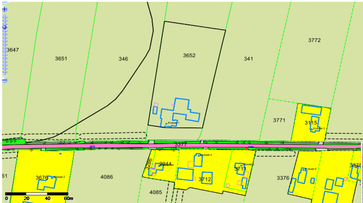
Uitsnede bestemmingsplan Buitengebied Achtkarspelen, rondom De Krúswei 1 te Harkema

Binnen dit artikel is ook een groot aantal wijzigingsbevoegdheden opgenomen, waarbij burgemeester en wethouders in voorkomend geval de bestemming mogen wijzigen in een van de genoemde bestemmingen.