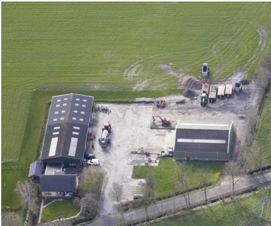
Perceel Spekloane 55 te Boelenslaan in de huidige situatie

Het perceel bestaat nu uit aan de voorkant een woning en aan de achterzijde daarvan een aantal loodsen voor opslag en voertuigen met geasfalteerd terrein. Daarachter ligt een weiland waarop de gewenste uitbreiding is gepland. Verzoeker geeft aan dat de extra opslagruimte wegens ruimtegebrek nodig is. Ten opzichte van de huidige bedrijfsbestemming heeft hij nog een uitbreiding van 50% nodig. De bedrijfsactiviteiten op de beoogde bedrijfsbestemming bestaan uit de bouw van een loods waarin voertuigen komen te staan t.b.v. het bedrijf welke nu buiten staan of te krap gestald staan in de bestaande loodsen. De machines worden dagelijks gebruikt voor werkzaamheden behorende bij het loonbedrijf (met name landbouw). Verzoeker geeft aan dat het aantal verkeersbewegingen van het bedrijf door de uitbreiding niet toeneemt.