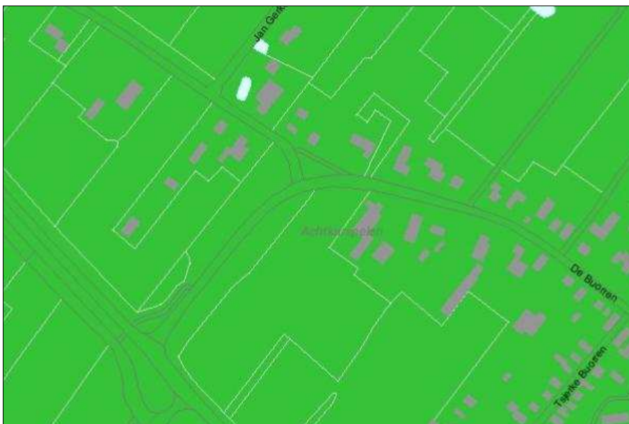
Figuur 1. Fragment van de FAMKE, steentijd-bronstijd

Uit de informatie blijkt dat, wat betreft de steentijd-bronstijd, het plangebied op de FAMKE is aangeduid als 'onderzoek bij grote ingrepen. Op basis van uitgevoerd archeologisch onderzoek is vastgesteld dat mogelijke archeologische waarden in dit gebied niet goed behouden zijn. Omdat mogelijke archeologische waarden diep in de bodem mogelijk nog wel goed behouden zijn geeft de provincie het advies om bij ontwikkelingen met een oppervlakte van ten minste 2,5 ha een karterend proefsleuvenonderzoek uit te voeren. In figuur 1 is wat betreft de steentijd-bronstijd, het voor het plangebied betreffende fragment van de FAMKE weergegeven.