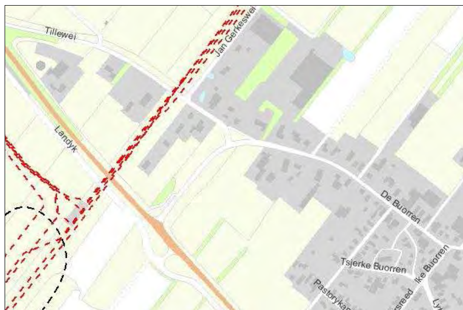
Figuur 3. Fragment van de risicokaart

Uit de informatie van de risicokaart blijkt dat er in het plangebied geen risico's van ongevallen met gevaarlijke stoffen bekend zijn. Ook blijkt dat er in de directe omgeving van het plangebied risico's van ongevallen met gevaarlijke stoffen bekend zijn. De risico's betreffen de verschillende aardgastransportleidingen op een afstand van ongeveer 150 meter ten noordwesten van het plangebied. In tabel 1 is een overzicht van de verschillende aardgastransportleidingen opgenomen. Hierbij zijn ook de bij deze leidingen aanwezige risicozones voor het plaatsgebonden en groepsrisico opgenomen.