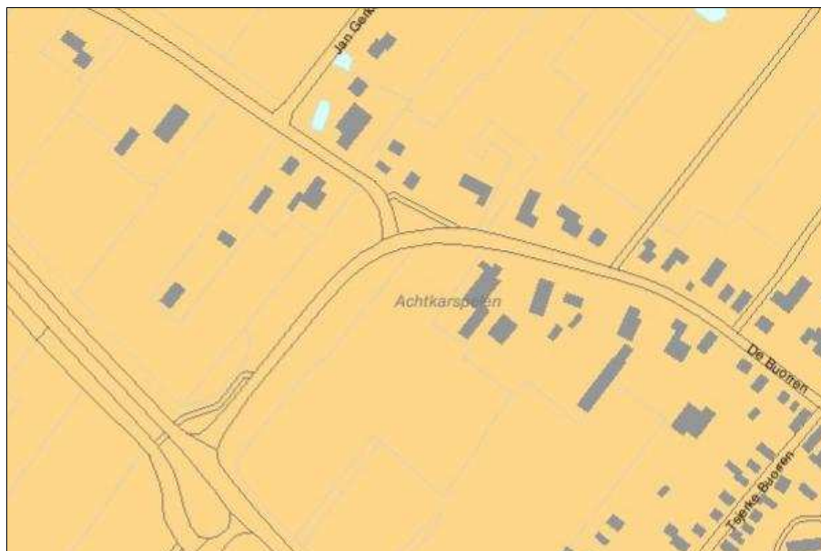
Figuur 2. Fragment van de FAMKE, ijzertijd-middeleeuwen

CONCLUSIE In het voorliggende bestemmingsplan zijn geen ontwikkelingen met een oppervlakte van ten minste 5.000 m 2 voorzien. Het uitvoeren van een karterend proefsleuvenonderzoek of een historisch en karterend onderzoek is dan ook niet noodzakelijk. Dit betekent dat de uitvoerbaarheid van het voorliggende bestemmingsplan niet door archeologische waarden wordt belemmerd.