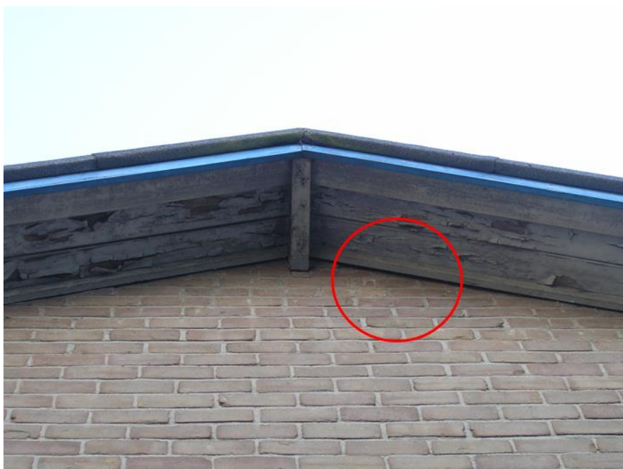
Uitvlieglocatie van een gewone dwergvleermuis aan oostzijde van de loods op het erf van De Dellen 43