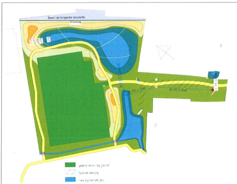
Figuur 2, compensatieplan aanleg vijverpartij (in blauw weergegeven)