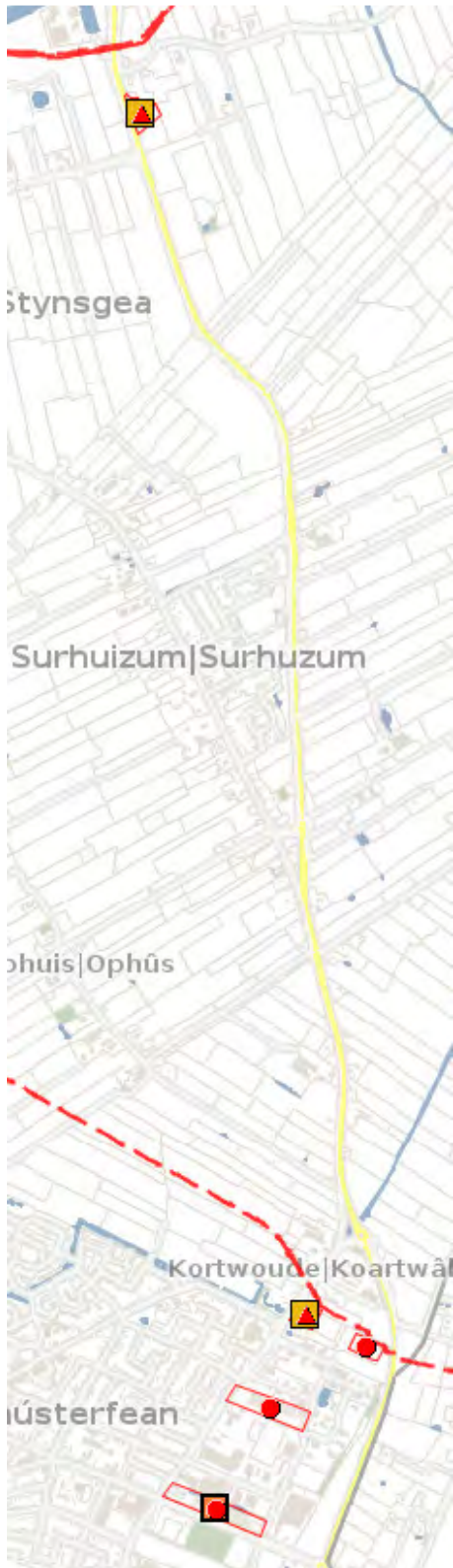
Figuur 1: risicobronnen nabij plangebied

Uit de professionele Risicokaart blijkt dat in en in de directe nabijheid van het plangebied risicobronnen zijn gelegen waarvan de risicocontouren of de invloedsgebieden (mogelijk) zijn gelegen binnen het plangebied (zie figuur 1).