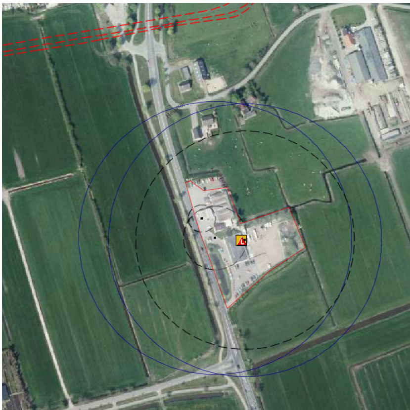
Figuur 2: LPG-tankstation aan de Uterwei: PR 10-6 contouren zwarte stippellijnen Invloedsgebieden blauwe cirkels

Aan de Uterwei 20 te Augustinusga is een LPG-tankstation gevestigd (zie figuur 2). Het tankstation ligt buiten het plangebied.