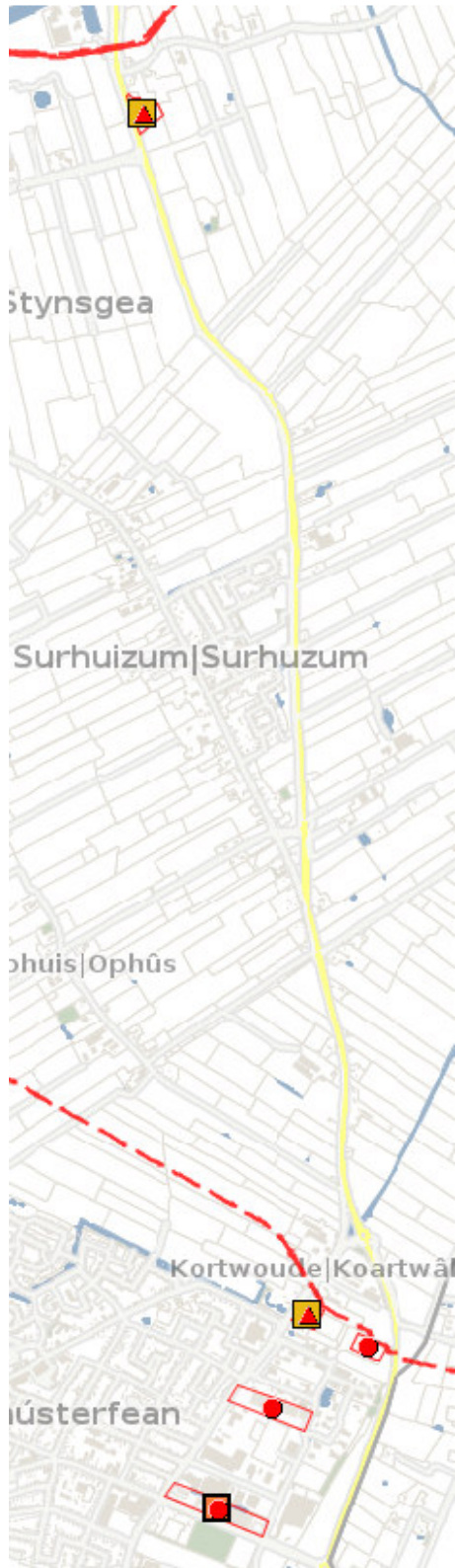
Figuur 1: risicobronnen nabij plangebied

Uit de professionele Risicokaart blijkt dat in en in de directe nabijheid van het plangebied risicobronnen zijn gelegen waarvan de risicocontouren of de invloedsgebieden (mogelijk) zijn gelegen binnen het plangebied (zie figuur 1).