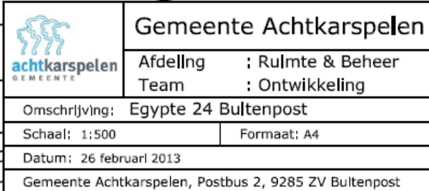
(ontwerp) ruimtelijke onderbouwing Egypte 24 Buitenpost