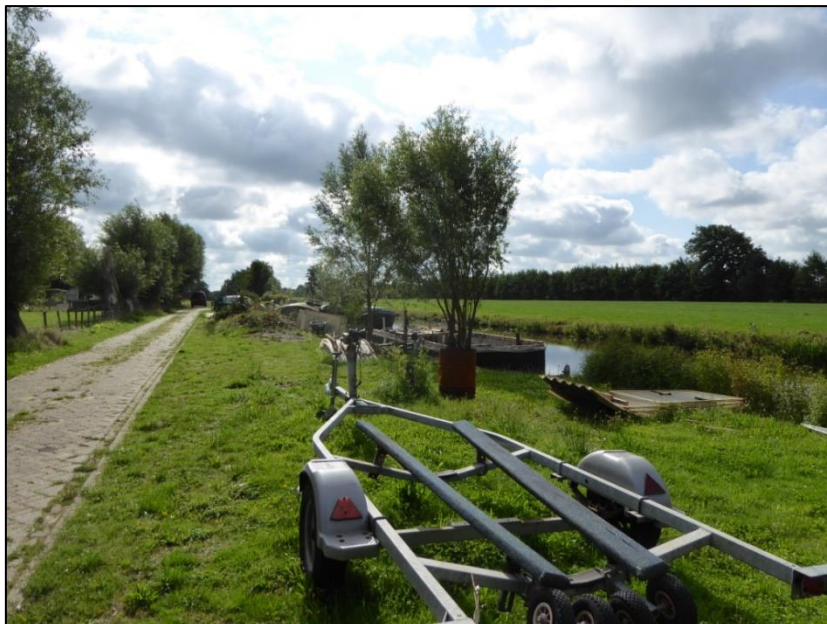
Impressie van het projectgebied op 21 augustus 2018.