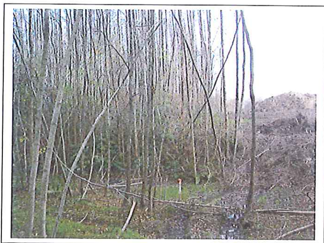
Overgebleven begroeiing aan rand van de uitbreidingslocatie

De locatie bestaat uit een gronddepot dat begroeid is met jong bos aan de westzijde van de bestaande zandwinplas. Het bos groeit op een ophoging bestaande uit lemige en kleiige topgrond. De leeftijd wordt gezien de dikte van de bomen geschat op ca. 15 jaar. De randen van de plas zijn begroeid met riet, lisdodde en plaatselijk wilgen.