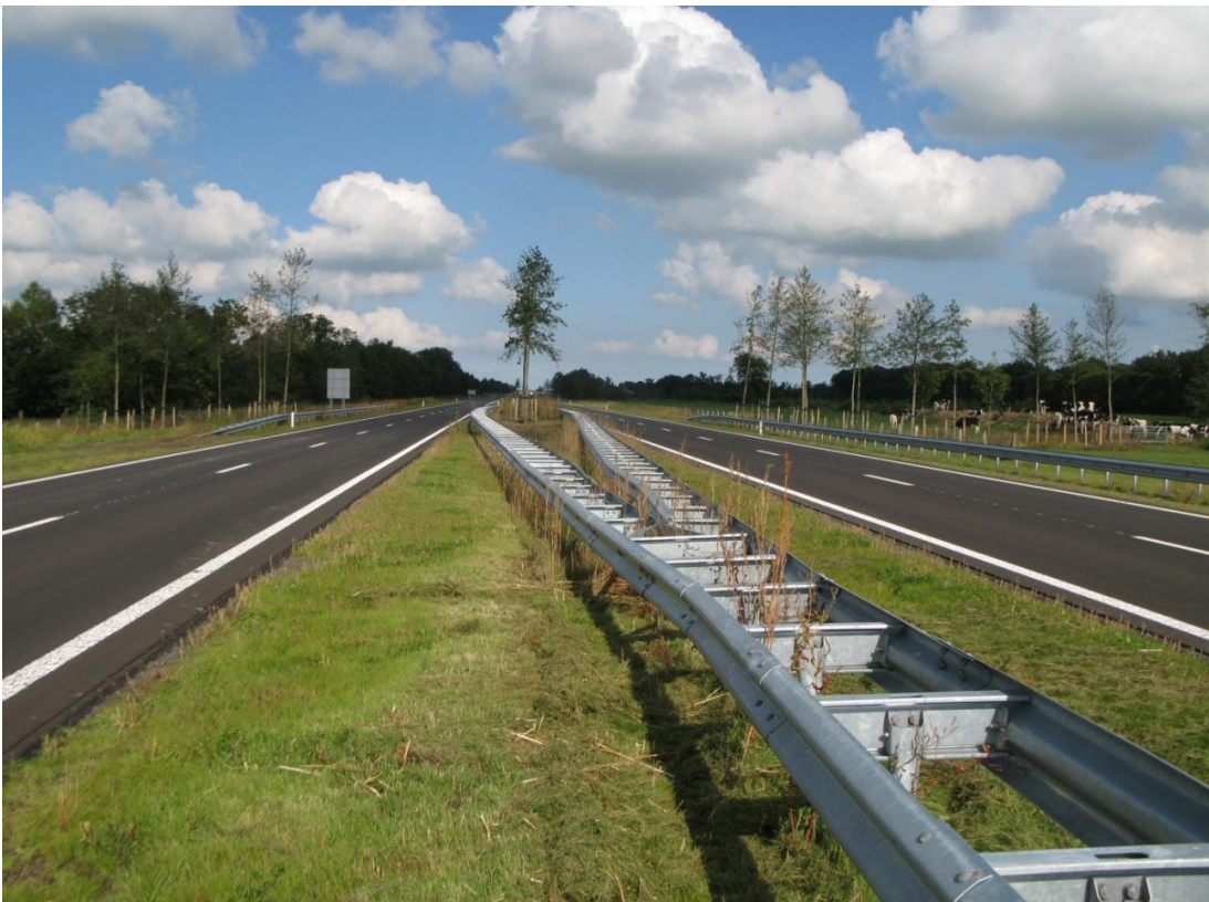
Figuur 2 - Visualisatie van een vleermuisverbindingzone in de vorm van een 'hop-over'. De foto geeft een impressie van een 'hop-over' zoals die recentelijk is gerealiseerd langs de 'Centrale-As' tussen Drachten en Dokkum (figuur op basis van Studio D).