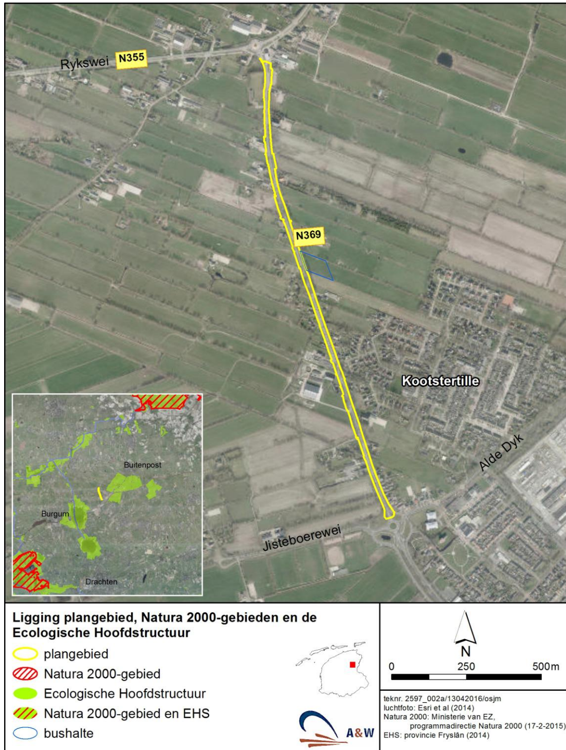
Figuur 1. Het plangebied voor de reconstructie van de N369 bij Kootstertille.