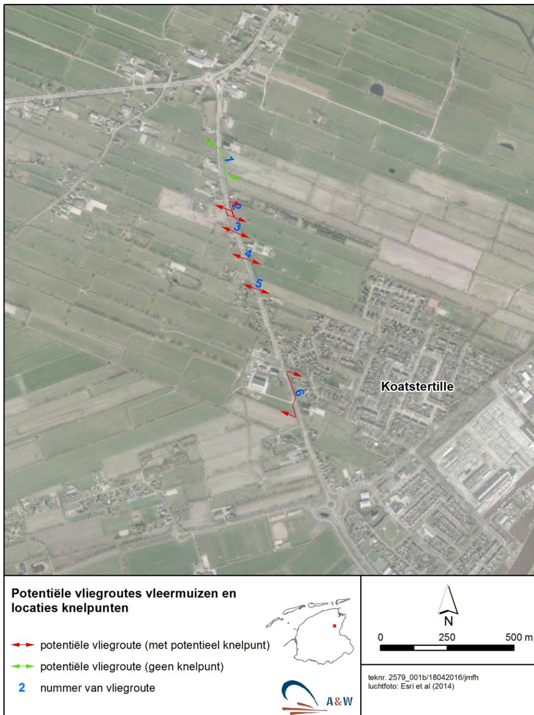
Figuur 3. Potentiële vliegroutes over en langs de N369 bij Kootstertille en knelpunten.