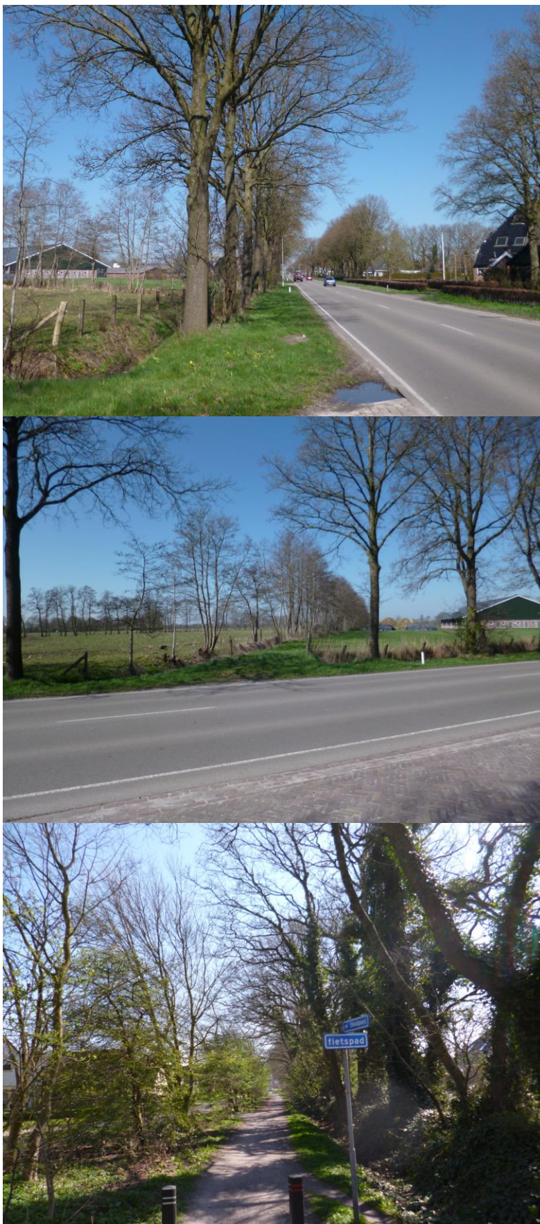
Foto 1 t/m 3 (A&W april 2016). Foto's genomen ter hoogte van vliegroute 6 (zie figuur 3).