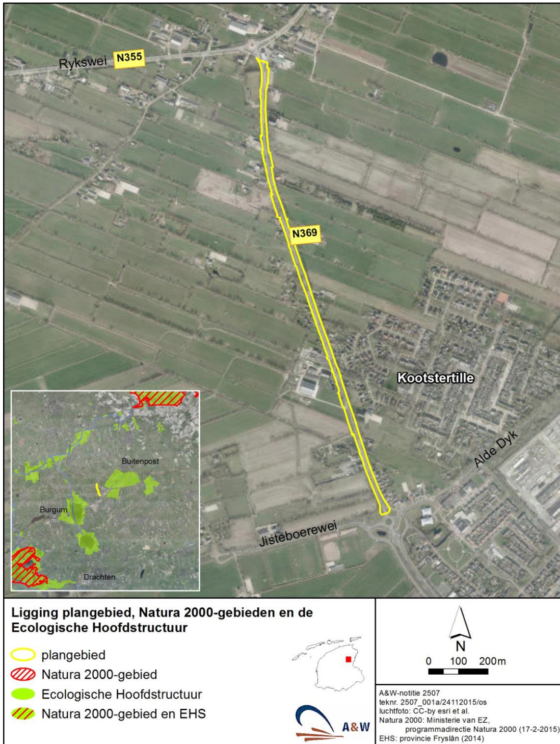
Figuur 1. Het plangebied voor de reconstructie van de N369 bij Kootsterille.