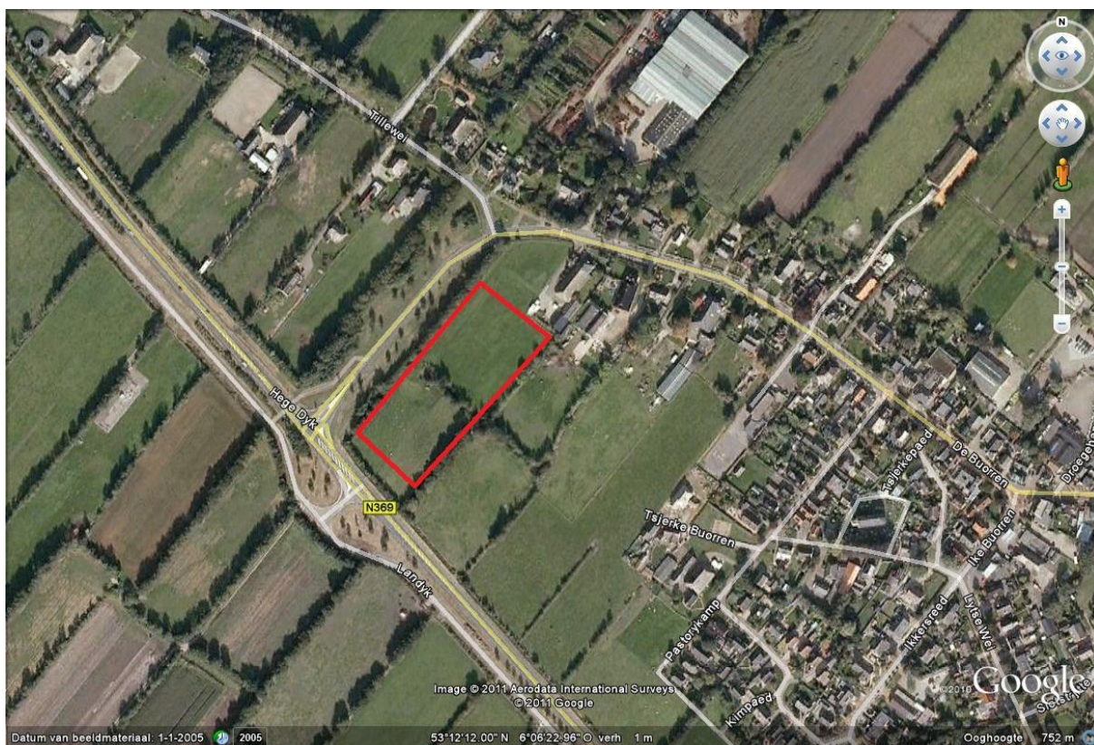
Figuur 1. Luchtfoto van het plangebied (rood omlijnd).

Aangezien het hier een ruimtelijke ingreep betreft, is een toetsing aan de Flora- en faunawet een vereiste. De consequenties van de beoogde ruimtelijke ingreep zijn via een korte ecologische beoordeling, een quick scan, getoetst aan de bepalingen van de Flora- en faunawet. In deze rapportage wordt verslag gedaan van de resultaten van deze beoordeling, waarbij adviezen zijn geformuleerd hoe te handelen conform de bepalingen in de Flora- en faunawet.